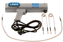
Heat Inductor (Euro Plug) | 5835