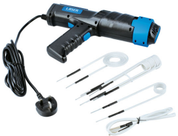
Heat Inductor Kit 1000W (UK Plug) | 8680