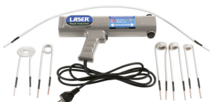
Heat Inductor Kit 7pc (Euro Plug) | 7504